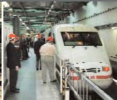
von links nach rechts: Hamburger Hochbahn: Salon-Triebwagen »Hanseat« mit einem ReisetTeilnehmer aus der Schweiz. Lokschuppen Aumühle: die ReisetTeilnehmer versammeln sich zum Gruppenfoto. Hamburg-Eidelstedt: Ein lang gehegter Wunsch: Endlich ins Cockpit eines ICE.